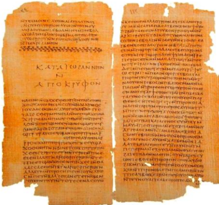
Απόκρυφα Ευαγγέλιο Ιωάννου

Μερικά από τα Γνωστικά κείμενα του Nag Hammadi, δεν έχουν στοιχεία από την χριστιανική παράδοση, αντλώντας την έμπνευσή τους από τα ιουδαϊκά κείμενα, και ιδίως την Παλαιά Διαθήκη, όπως άλλωστε και ο Χριστιανισμός. Πολλοί θεωρούν οξύμωρο αυτόν τον συνδυασμό Γνωστικισμού – Ιουδαϊσμού, ξεχνώντας ότι ακόμη ένας από τους πρώτους διάσημους Γνωστικούς, ο Σίμων ο Μάγος, ήταν Γνωστικός και Σαμαρείτης. Φυσικά τα λίγα που γνωρίζουμε για τους Ιουδαίους Γνωστικούς προέρχονται από τα κείμενα των πολεμίων τους, όπως συνέβαινε μέχρι τώρα και με τους Χριστιανούς Γνωστικούς.