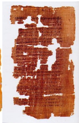
Ευαγγέλιο του Ιούδα