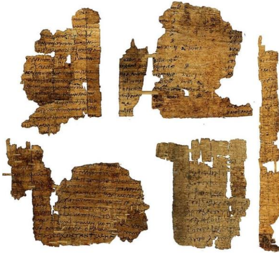
Από τα ευρήματα στο Nag Hammadi της Αιγύπτου, το 1945